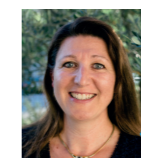
Carole BONTEMPS- HESDIN Maire 2 e vice-présidente aménagement du territoire et de l'habitat